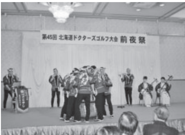
前夜祭『江差町餅つき囃子』と『江差追分』

本大会の開催に際して大変なご尽力をいただいた函館ドクターズゴルフ会の役員の方、道医ならびに函館市医師会事務局の方々に、誌面をお借りしお礼を申し上げます。