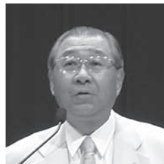
札幌市医師会 山光会長