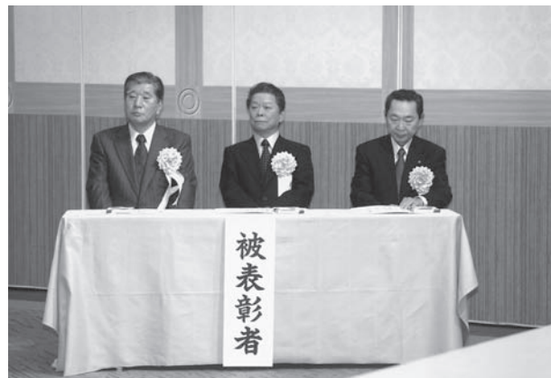
平成20年度被表彰者

なお、平成21年度の歳出予算において、組合員等へ組合創立50周年記念誌の発行を計画している。