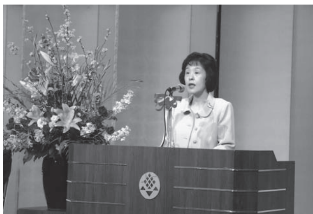
高橋はるみ北海道知事祝辞