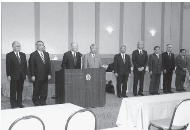
新役員の就任挨拶

保健事業として、実施計画を着実に遂行していかなければならない。特に特定保健指導については、個別医療機関での対応では実施計画の遂行にはなかなか厳しい状況にある。そのためにも、組合員の理解と参画を促しながら、北海道医師会・郡市医師会の協力を得て、特に平成21年度は郡市医師会所属の健診センター等の協力を得ながら実施して行く方向である。