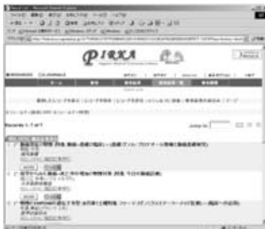
図1. 札幌医大システムからのNDL-OPACの検索結果

札幌医科大学附属図書館ホームページ URL http://www.sapmed.ac.jp/libr/ (Contents内の「MetaLib/SFX」が国内雑誌記事検索サービスへのリンクです。)