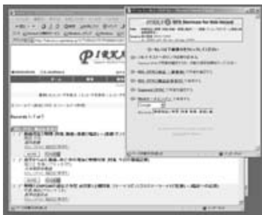
図2. 検索結果論文のサービスメニュー