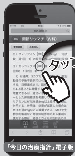
「今日の治療指針」電子版

※ 2016年1月からご覧いただけるデータは、両書籍とも2015年版のものです。2016年版のデータをご覧いただけるようになるのは、2016年4月の予定です。