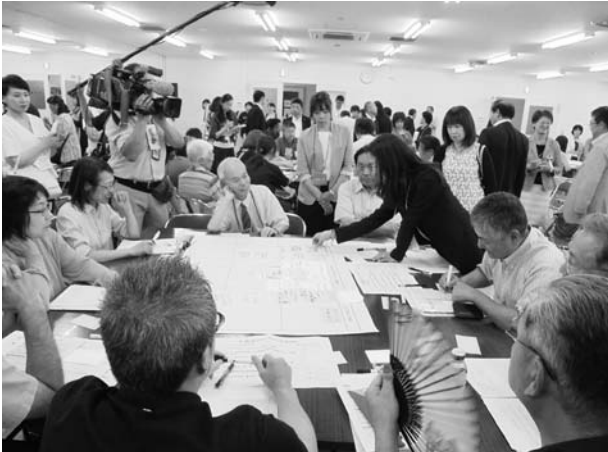
グループワーク風景

会員の皆様も、「六位一体」協議会・がんサミットにご協力・ご支援をお願い申し上げます。 (北海道新聞 8月3日付に詳しい記事が掲載されております)