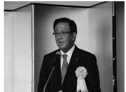
祝辞 北海道 辻 泰弘副知事