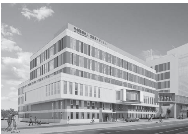
記念塔病院（新病院）

URL : https://www.kinentou.or.jp/endoscopy-center