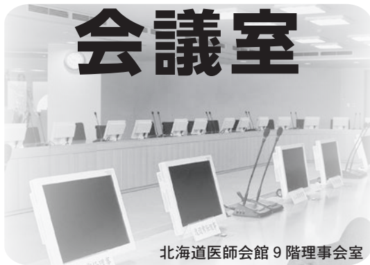
北海道医師会館 9階理事会室