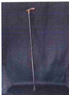
T字杖 (これだけと 考えないように)