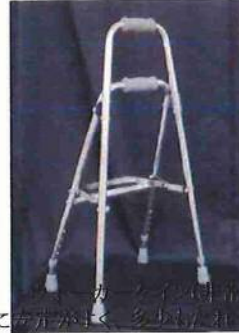
ウォーカー (安定がよく、多量に歩 いても大丈夫)