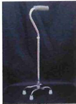
四点杖 (安定がよく、手を放し ても立っている)