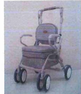
シルバーカー (荷物を運んだり、腰掛け て休める。避難所、施設内でも使える)