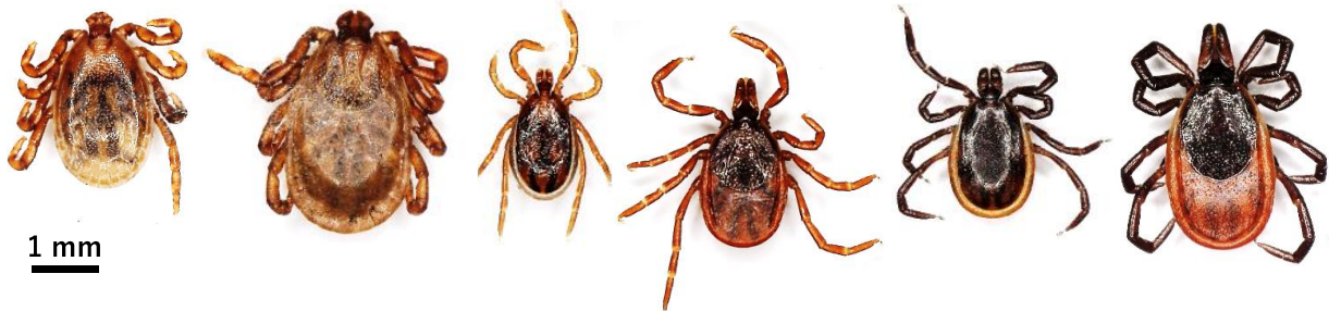
図 1. 北海道内でよく見られるマダニ (左から順に、オオトゲチマダニのオス、メス、ヤマトマダニのオス、メス、シュルツェマダニのオス、メス。特にヤマトマダニ、シュルツェマダニが人を刺すと言われている)