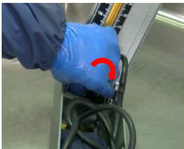
⑤右45度に傾けた状態で、水銀コックを右に戻します。