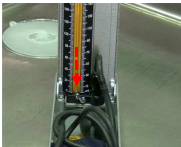
③目盛りの水銀が、みるみるタンク内に戻ります。(目盛りが下がりきるまで待ちます。)