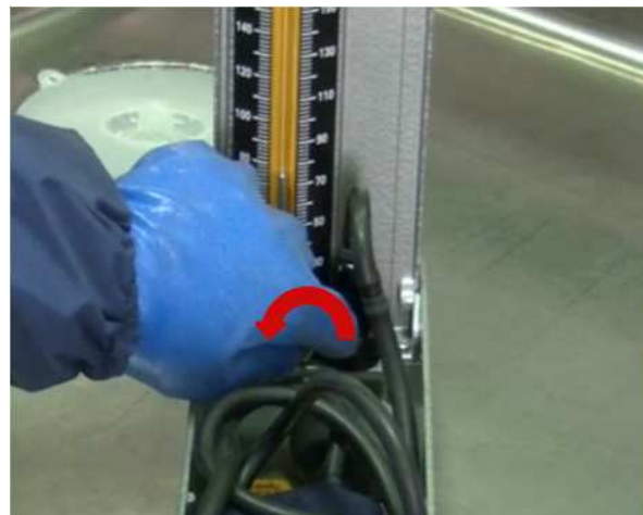
②水銀コックをつまんで左に回します。