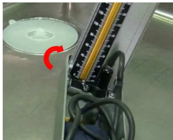
④下がり切ったら右45度傾けます。 (タンク内に水銀が入り切ります。)