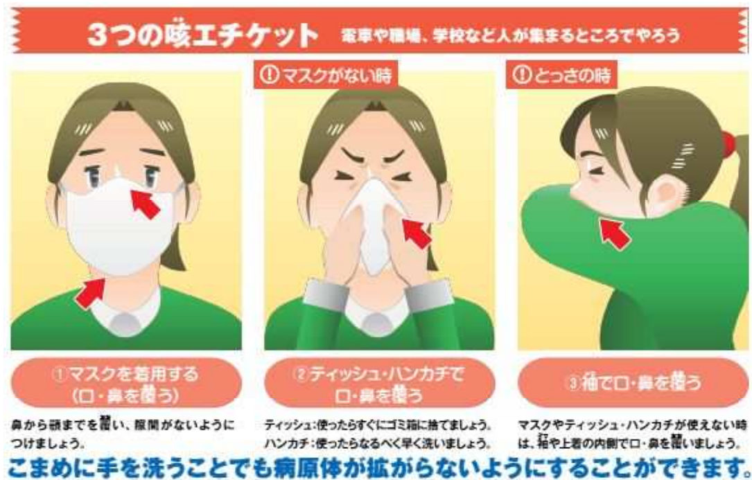
図3 咳エチケットについて