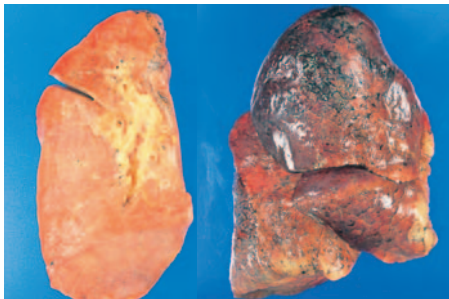
▲タバコを吸わない人の肺

タバコを吸う人の肺には煙にふくまれるタールや炭素などが少しずつたまっていき、数十年後には肺が真っ黒になるほど汚れてしまいます。それが原因でなる肺がんや、体のいろいろな場所のがん発生率も高くなります。きれいな肺のまま一生をすごしたいなら、今すぐタバコをやめること！