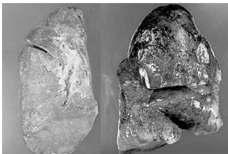
▲タバコを吸わない人の肺

タバコを吸う人の肺には煙にふくまれるタールや炭素などが少しずつたまっていき、数十年後には肺が真っ黒になるほど汚れてしまいます。それが原因でなる肺がんや、体のいろいろな場所のがん発生率も高くなります。きれいな肺のまま一生をすごしたいなら、今すぐタバコをやめること！