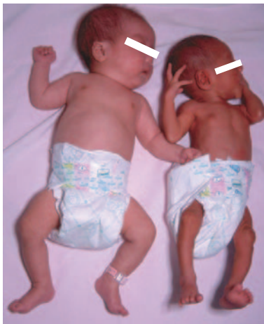
◀妊娠中の喫煙が原因とみられる低体重児(右)

喫煙はホルモン分泌などに影響して不妊症の原因に。また、妊娠中にタバコを吸うと、子宮・胎盤への血流量と酸素供給量の減少から、おなかにいる赤ちゃんが低酸素状態にさらされ、流産、早産、低体重児出産の危険が1.5~2倍も高くなります。安全出産で元気な赤ちゃんを望むなら、遅くとも妊娠初期までに禁煙を実行すべきです。