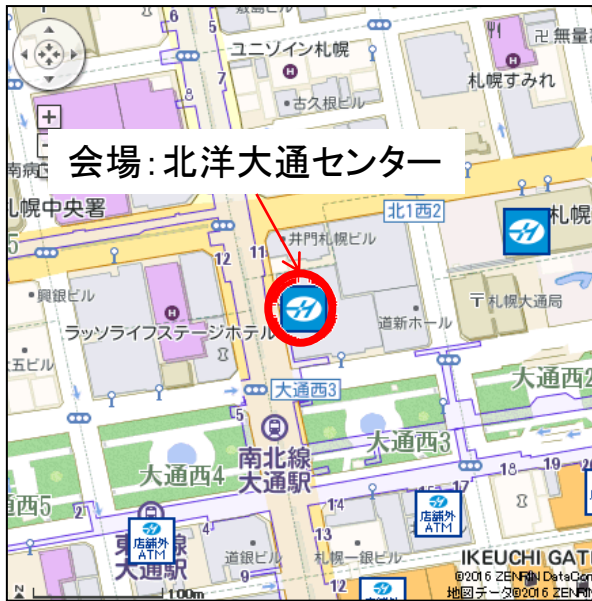
北洋大通センター内案内図(1階)