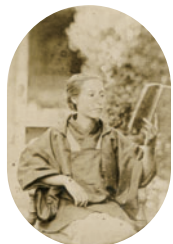
「読書をするイネ」 大洲市立博物館所蔵