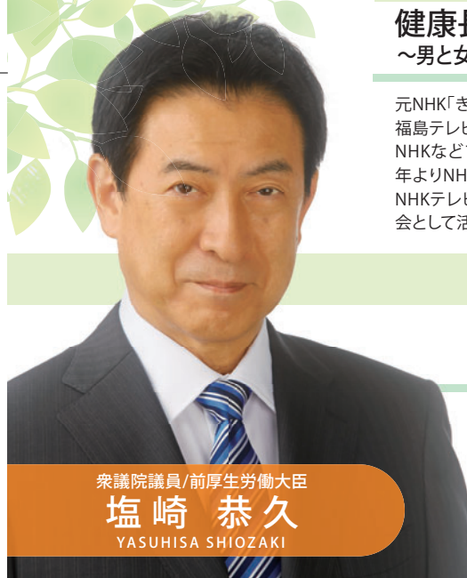
衆議院議員/前厚生労働大臣