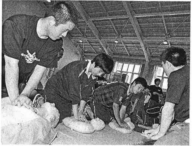
心肺蘇生講習に挑む高校生たち

【室蘭】室蘭東翔高校の2年生が16日、緊急時の心肺蘇生法や自動体外式除細動器(AED)の扱い方を学ぶ実技講習に挑戦した。