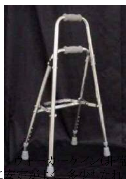
ウォーカーケイン(歩行 に安定がよく、多少もたれ ても大丈夫)