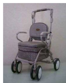
シルバーカー (荷物を運んだり、腰掛け て休める。避難所、施設内 でも使える)