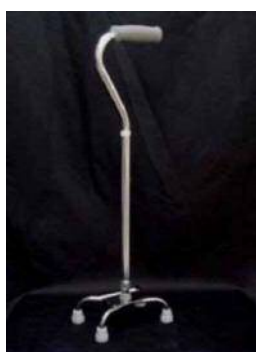
四点杖 (安定がよく、手を放し ても立っている)