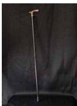
T字杖 (これだけと 考えないように)